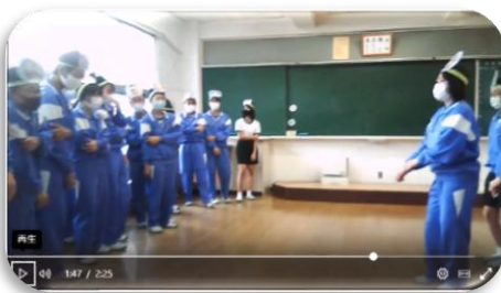
▲1-4 4組ストーリー 劇