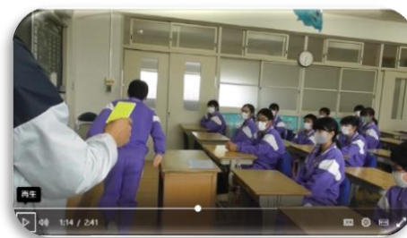
▲1-5 5組の平和な日常 コント