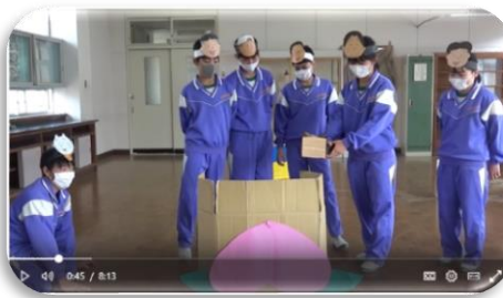
▲1-2 桃工さん 劇