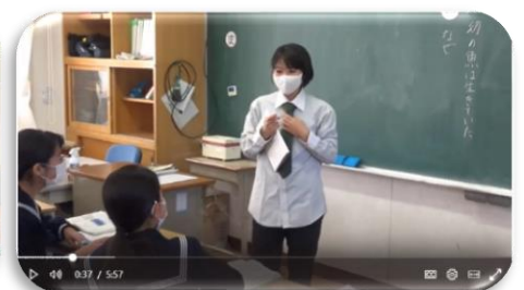
▲1-3 先生あるある コント