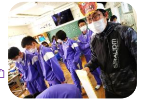
福アイテム：豆を手に入れた!!