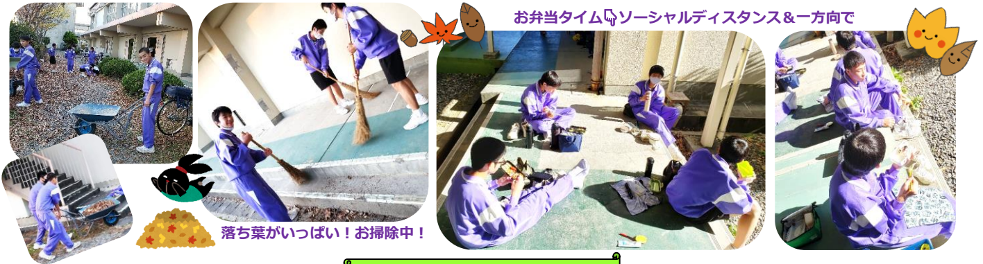
お弁当タイム☺ソーシャルディスタンス&一方向で

2020年もいよいよ1か月を切り、急に寒さが増してきました。空気も乾燥し、コロナに加え、風邪やインフルエンザにも気を付けなくてはなりません。御家庭でも、毎朝の検温や健康チェック、サインなど、保護者の皆様には御負担をお掛けしていますが、引き続き御協力お願い致します。