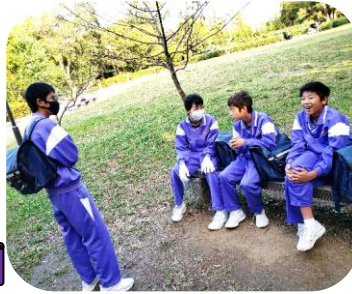
開場前…待ちきれない！