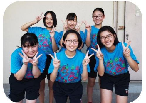
(全員とは会えませんが……♡) 部活動、新体制がスタート！チームを引っ張っていく立場になりました！！