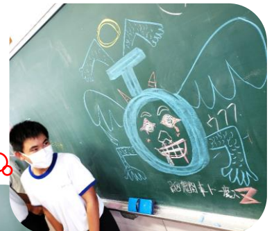
ある雨の日… 最凶鬼関車ト一魔ス?