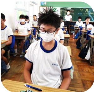
体育の後。汗だくツツツ頭に。