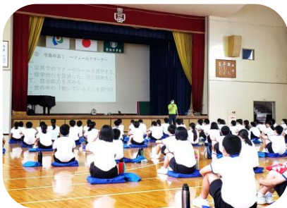
会議室で道徳授業