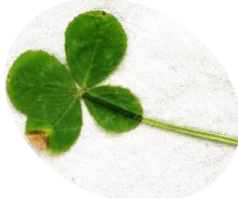
四つ葉のクローバーを 色々な子が届けてくれます。