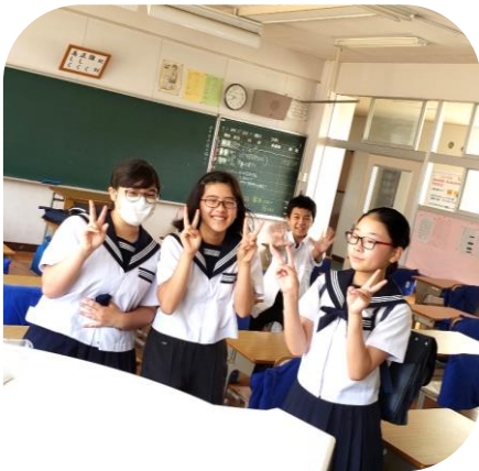
冷風機との出会い！

今年度は7月末まで授業が入っています。以前の学年通信(第10号)でもお願いしましたが、汗ふきタオルや着替え(体操服や下着)体を冷やすための保冷剤や氷嚢 ひょうのう 、スポーツドリンクとお茶なども御準備ください。