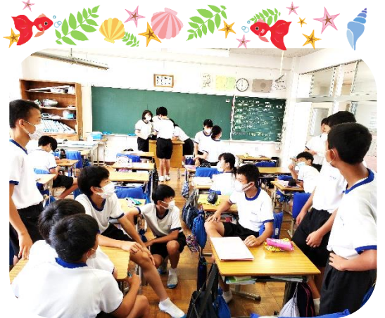
どこまで続くか…息はき？勝負！