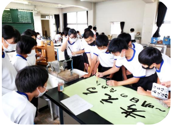
☺3組さん、学級目標を作成。一人一画ずつ、思いを込めて☺