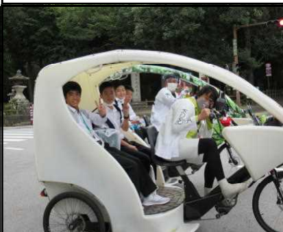
奈良公園散策by三輪車