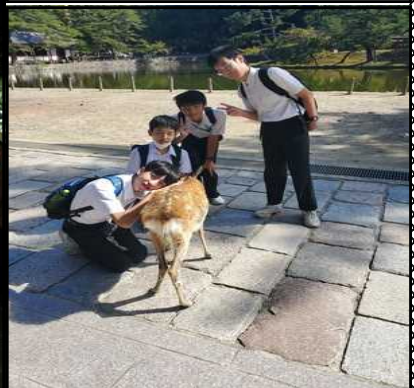
鹿さん「あったかい」