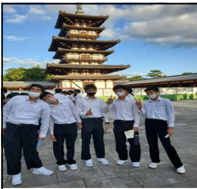
薬師寺五重の塔前