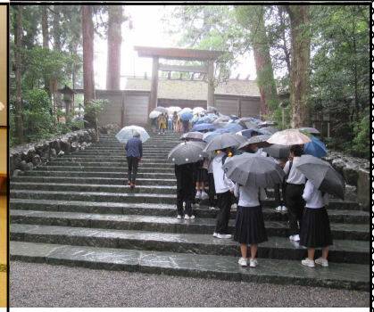
伊勢神宮内宮参拝