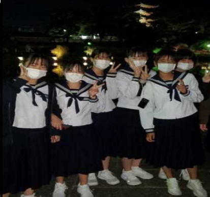
夜間散歩(猿沢の池)