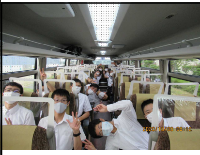
車内は勿論マスク着用