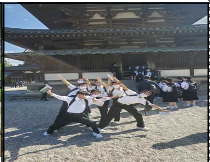
法隆寺五重の塔前