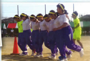
先生の笛でリズムをとって♪