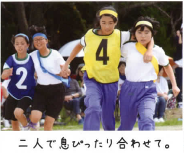
二人で息ぴったり合わせて。