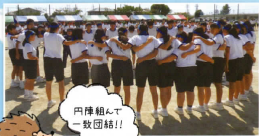
円陣組んで 一致団結!!