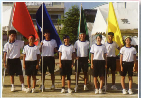
3年生実行委員さんお疲れ様でした。

私は今年の体育大会を、みんなが全力で戦い最後には楽しかったと思うような体育大会にしたいと思っていました。練習から3年生はもちろん、1年生も2年生も全員で声を出していたり協力し合っていて本当に楽しく、充実した練習ができたと思っています。本番では、全力で戦う姿を見られ本当に嬉しかったです。さらに、他のクラスを思いやり応援しながら走る姿や、転んでしまったクラスメイトを励まし一緒にゴールへ向かう姿など、たくさんのみんなの優しさを感じることができました。私は今年の体育大会で全力で取り組むことの楽しさや、一つの目標に向けみんなで頑張ると大きな力になるということを学びました。このことを次の豊中三大会である、合唱コンクールや、学校生活に生かし、残り少ない中学校生活を全力で楽しみたいと思います。体育大会のため熱く指導してくださった先生方、応援に来てくださったたり、家でサポートしてくださった保護者の方々、全力で戦った生徒のみなさん素晴らしい体育大会をつくってくださり本当にありがとうございました。