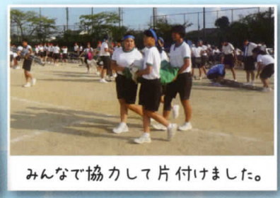
みんなで協力して片付けました。