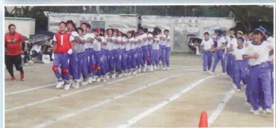
みんなで1組を応援する姿が素敵でした。