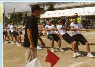
そーれっ! ひっはれー!!!