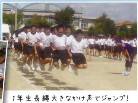
1年生長縄大きなかけ声でジャンプ!