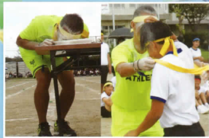
先生が体を張って助けくれた場面。