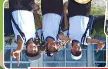
一足先にゴールしたグループ