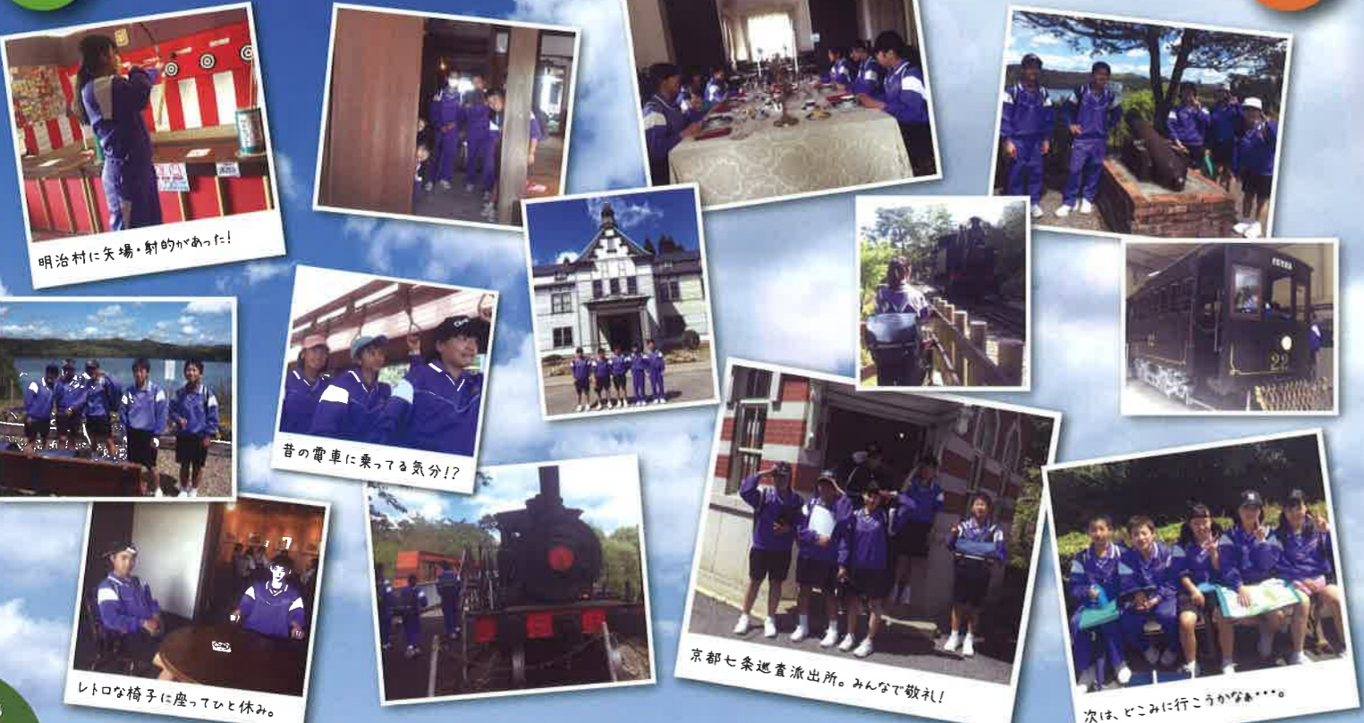
明治村に矢場・射的があった!