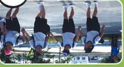
4-0の みんなでゴール