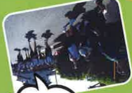
あと少し Hang in there!