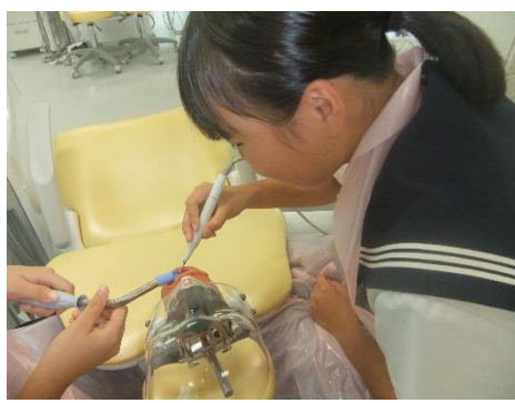
歯科衛生実習体験 静岡歯科衛生士専門学校