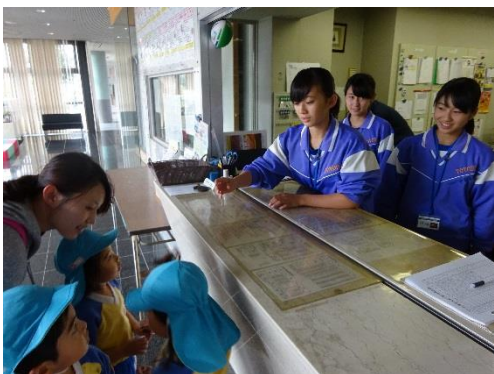
お客さんに笑顔で対応 アミューズ豊田

2年生は4日(水)、5日(木)と2日間の職場体験を行いました。生徒は実際に事業所に出向き、仕事を体験することで、働くことについて考える機会となりました。