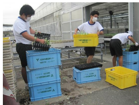
園芸用品の清掃作業体験 園芸流通センター