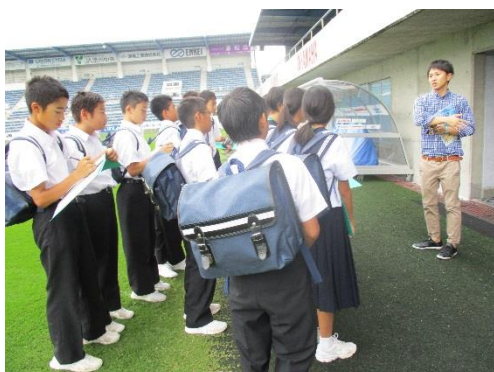
緑のピッチ、裏方さんの説明 (株) ジュビロ

1年生は地域にある企業や施設を訪ね、地域に貢献する人の夢や願いについての話を聞きました。「こころざし」について知る手がかりとなりました。