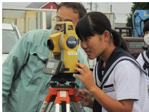
測量機器の使い方体験 吉田測量設計(株)