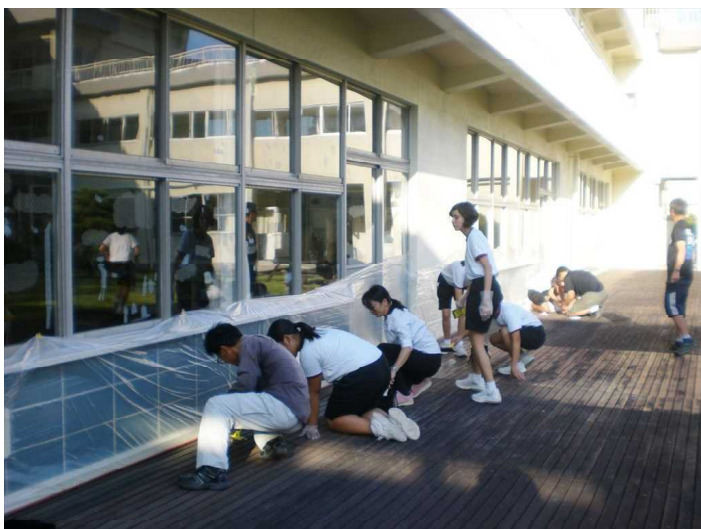
校長先生も一緒にペンキを塗りました。