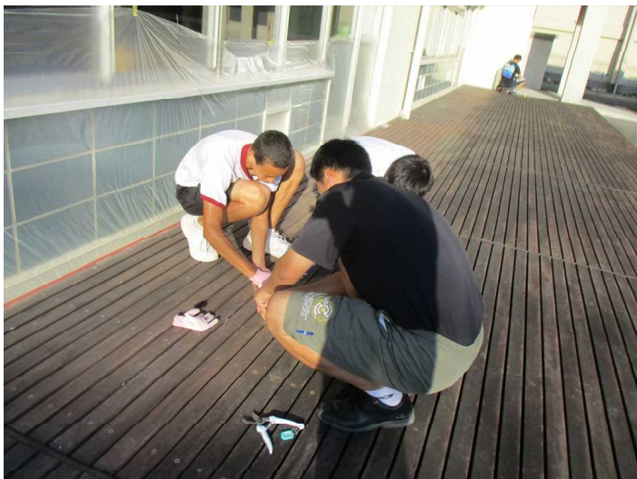
男性でペンキ塗りの準備をしました。 マスキングも丁寧にを行いました。