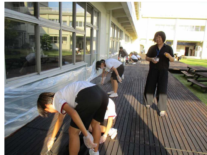
みんなで丁寧にペンキを塗っています。