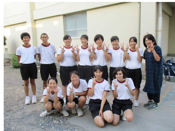
最後にみんなで記念撮影。