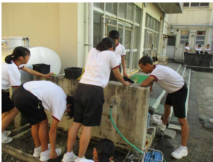
片付けもしっかりとやっています。